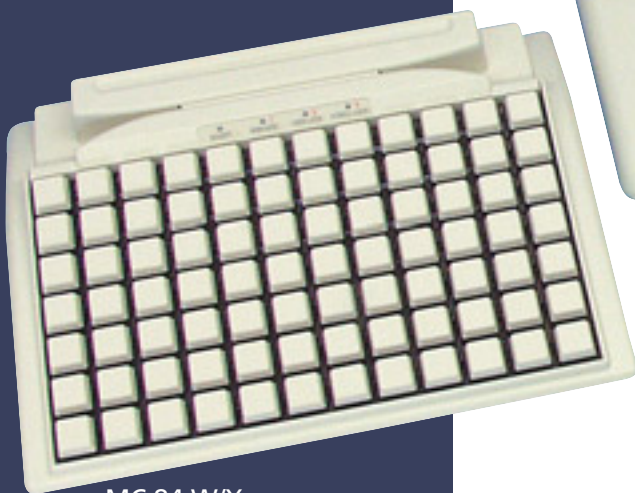
MC 84 W/X