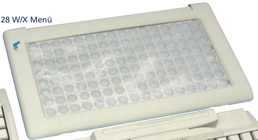
MR 128 W/X Menü