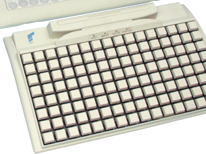
MC 128 W/X